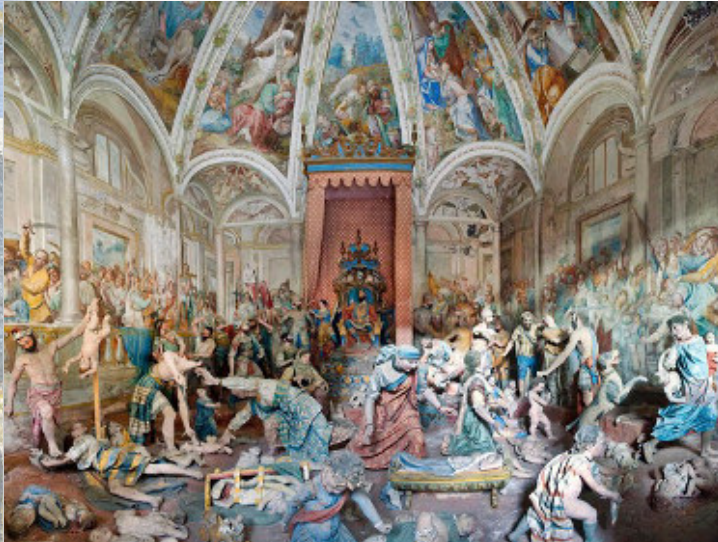
Angela Langhi | Strage degli Innocenti