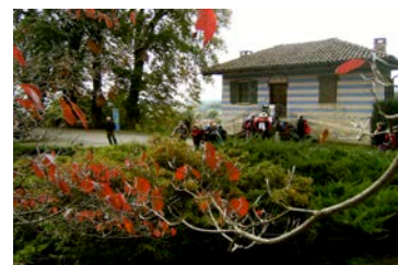
BORGHI, ANTICHE RESIDENZE e PARCHI