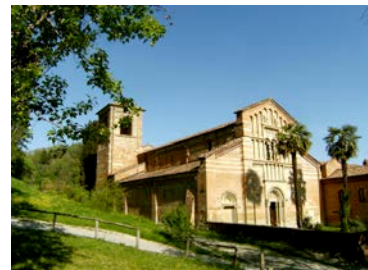
SPIRITUALITA' e DEVOZIONE