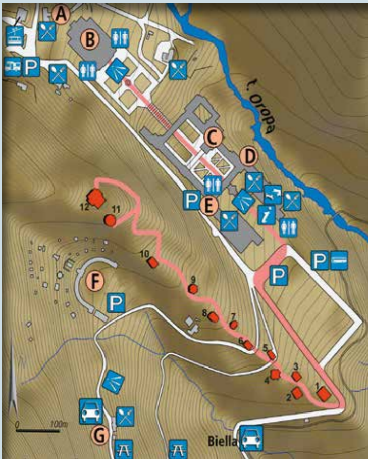
Cartographie de l'Université de Gênes - École Polytechnique - Département D.S.A.